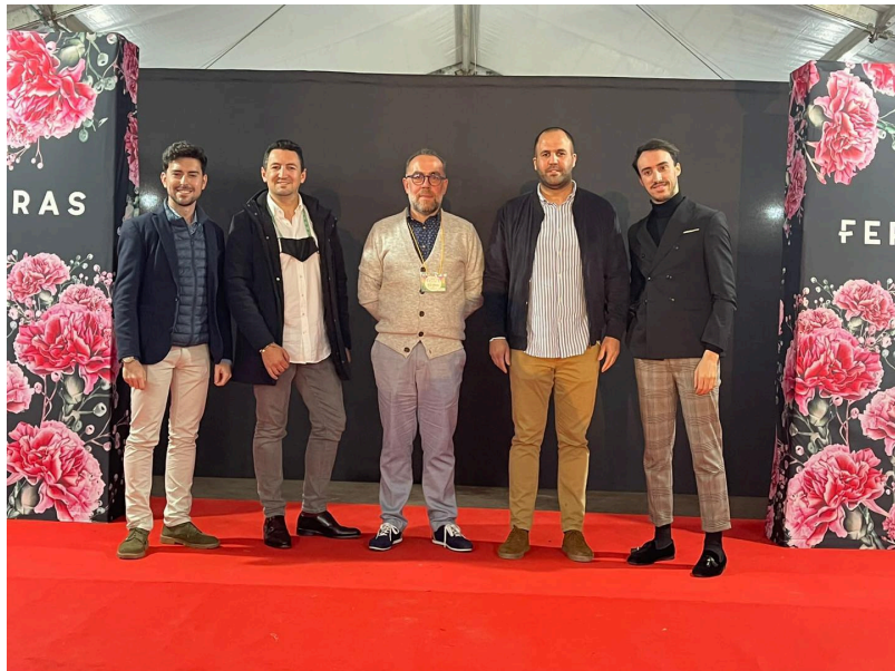
( http://www.bonares.es/export/sites/bonares/es/.galleries/noticias/imagenes-noticias-2022/DESFILE-MODA-FLAMENCA.jpg )