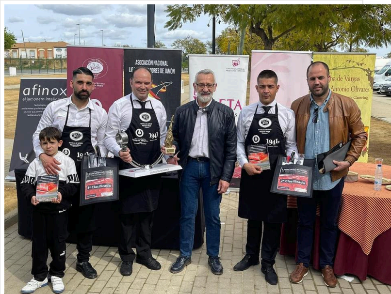
( http://www.bonares.es/export/sites/bonares/es/.galleries/noticias/imagenes-noticias-2022/CONCURSO-NACIONAL-CORTE-JAMON.jpg )