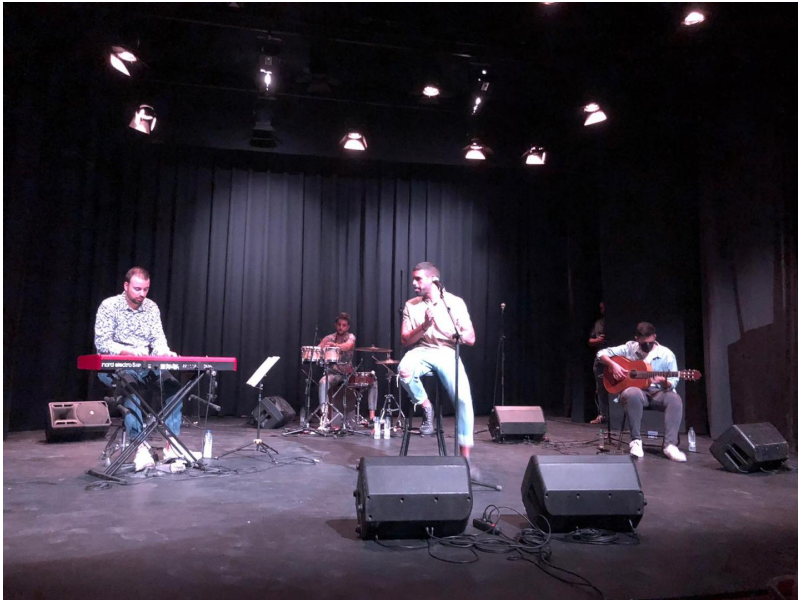
( http://www.bonares.es/export/sites/bonares/es/.galleries/noticias/imagenes-noticias-2020/weekend-joven21.jpg )