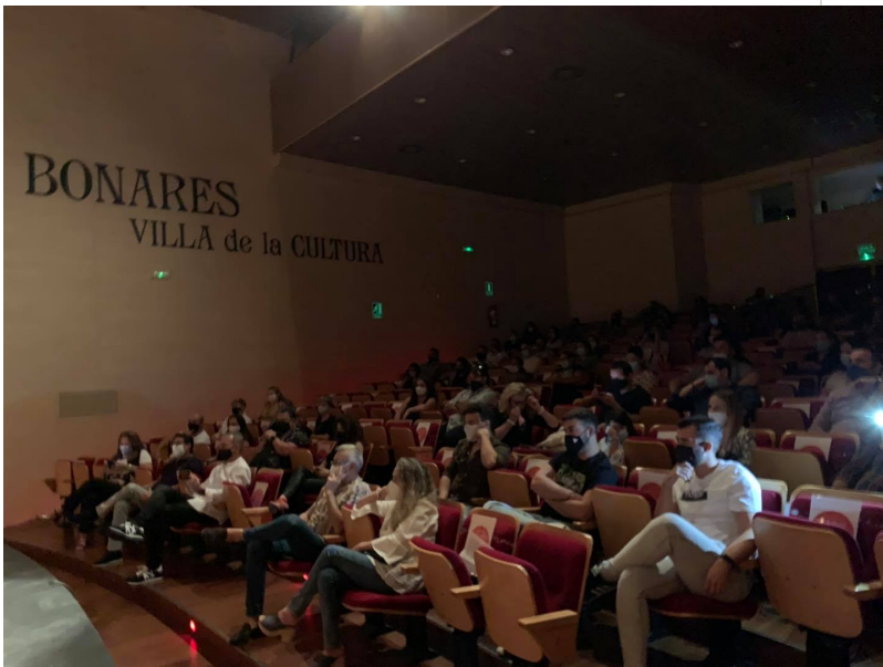
( http://www.bonares.es/export/sites/bonares/es/.galleries/noticias/imagenes-noticias-2020/weekend-joven11.jpg )