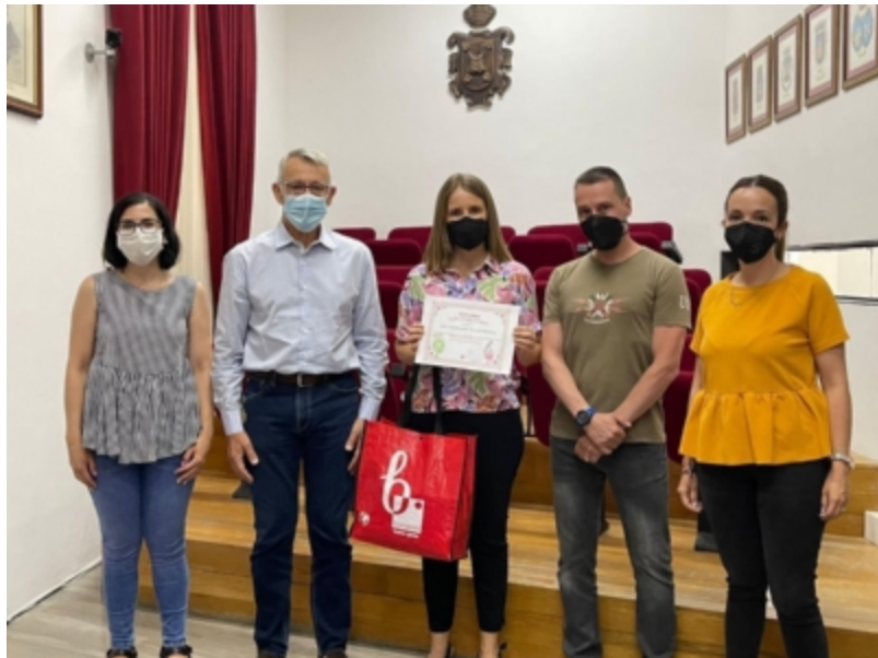
( http://www.bonares.es/es/.galleries/noticias/imagenes-noticias-2021/Image17.jpeg )