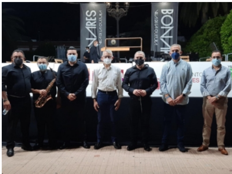
( http://www.bonares.es/es/.galleries/noticias/imagenes-noticias-2021/Image18.jpeg )