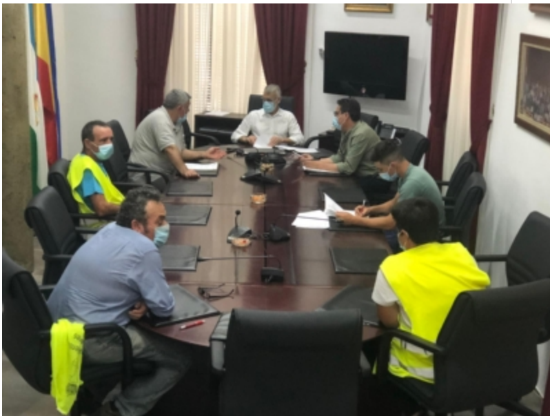
( http://www.bonares.es/es/.galleries/noticias/imagenes-noticias-2020/CONTRATACIONES-2.jpeg )