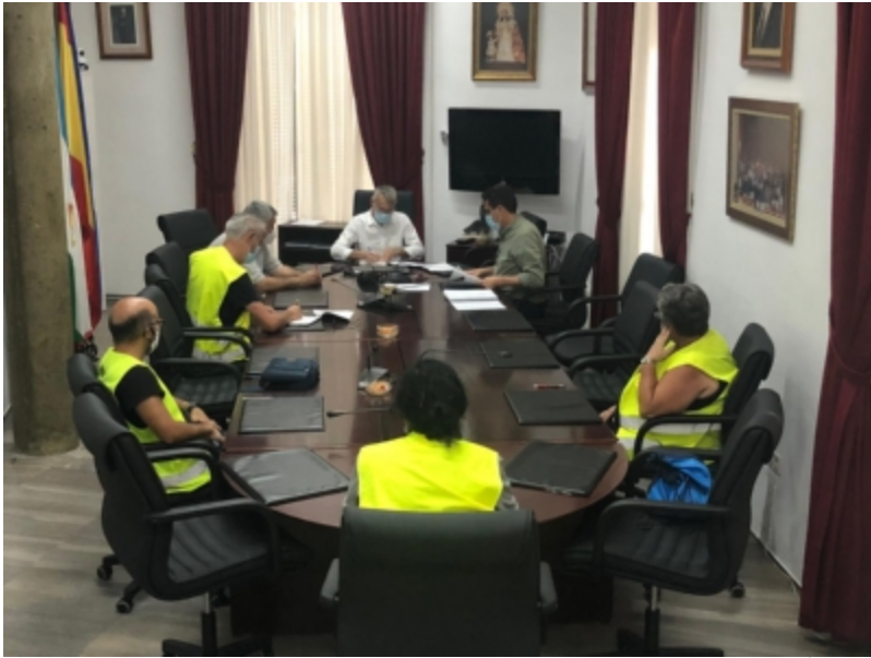
( http://www.bonares.es/es/.galleries/noticias/imagenes-noticias-2020/CONTRATACIONES-1.jpeg )