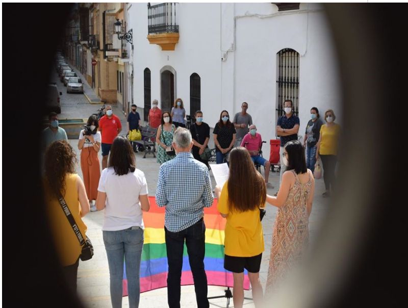
( http://www.bonares.es/export/sites/bonares/es/.galleries/noticias/imagenes-noticias-2020/105833587_3079625842153043_7385959039170 )