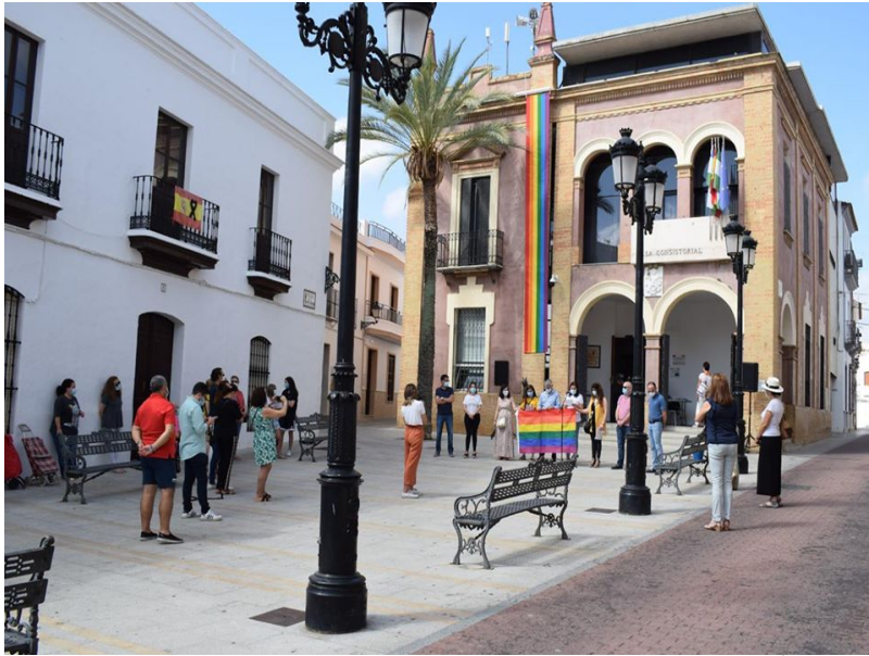
( http://www.bonares.es/export/sites/bonares/es/.galleries/noticias/imagenes-noticias-2020/106004547_3079626005486360_2635645975473 )