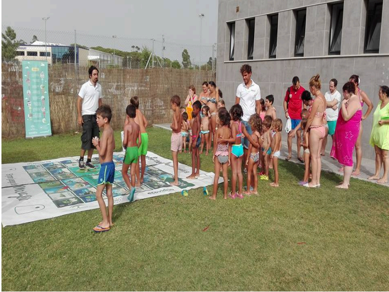
( http://www.bonares.es/export/sites/bonares/es/.galleries/noticias/imagenes-noticias-2016/ECOVIDRIO2.jpg )