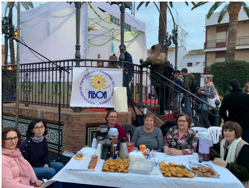
( http://www.bonares.es/export/sites/bonares/es/.galleries/noticias/imagenes-noticias-2019/fiboa-carta-a-reyes.jpg )