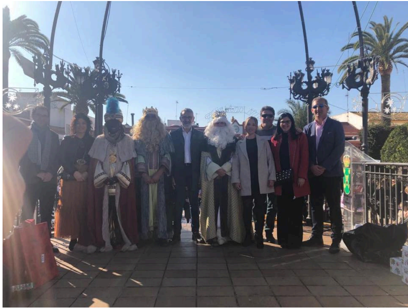
( http://www.bonares.es/export/sites/bonares/es/.galleries/noticias/imagenes-noticias-2019/dia6-enero.jpg )