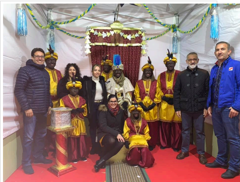
( http://www.bonares.es/export/sites/bonares/es/.galleries/noticias/imagenes-noticias-2019/eneetrega-cartas-rey-baltasar.jpg )

Se entregaron un total de 600 regalos aproximadamente a los niños y niñas de Bonares, además de realizarse varias tiradas de regalos y caramelos, desde el parque de la plaza España, para culminar las fiestas navideñas.