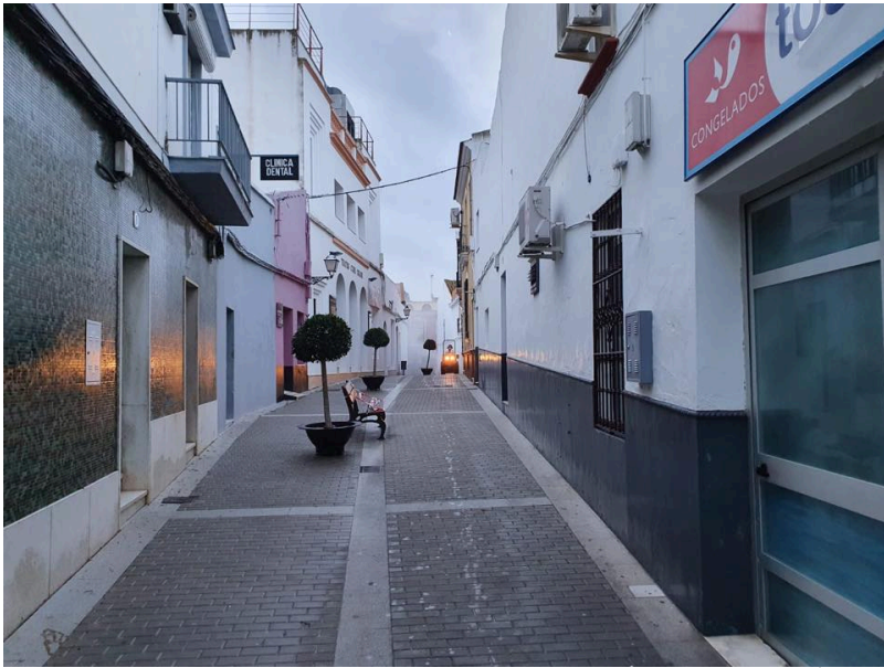
( http://www.bonares.es/export/sites/bonares/es/.galleries/noticias/imagenes-noticias-2020/DESINFECCION-DE-CALLES-11.jpg )