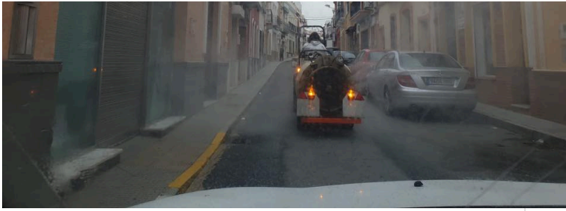
( http://www.bonares.es/export/sites/bonares/es/.galleries/noticias/imagenes-noticias-2020/DESINFECCION-DE-CALLES-9.jpg )