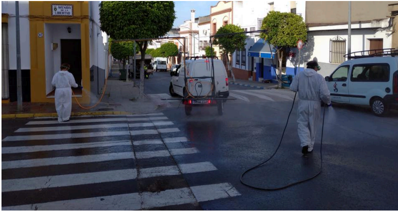
( http://www.bonares.es/export/sites/bonares/es/.galleries/noticias/imagenes-noticias-2020/DESINFECCION-DE-CALLES-14.jpg )