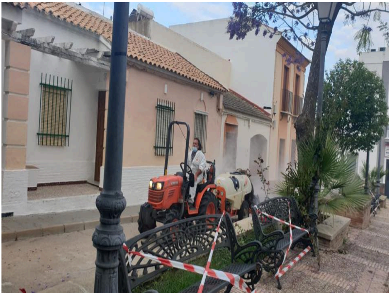
( http://www.bonares.es/export/sites/bonares/es/.galleries/noticias/imagenes-noticias-2020/DESINFECCION-DE-CALLES-17.jpg )