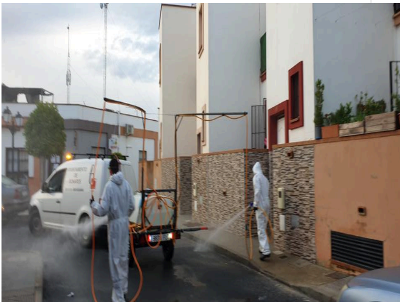
( http://www.bonares.es/export/sites/bonares/es/.galleries/noticias/imagenes-noticias-2020/DESINFECCION-DE-CALLES-18.jpg )